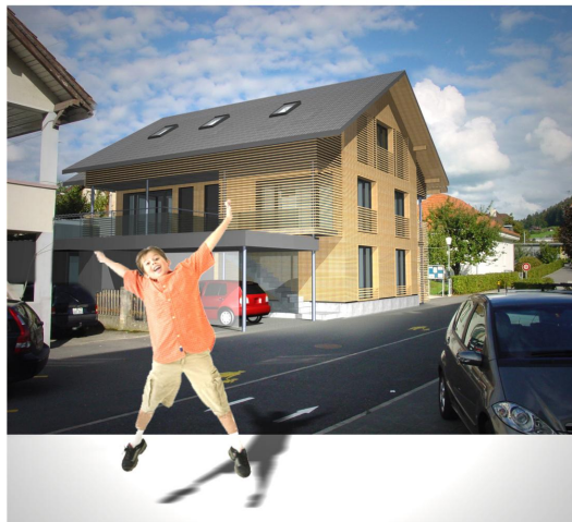
Ansicht Ankunft morgen

"Chum inne es ghört inne es isch es Spilhus". Wer mag sich an diese Aussage noch erinnern? Am 10. Januar 1968 kam diese Sendung zum ersten Mal im Schweizer Fernsehen und war vermutlich die erfolgreichste Kindersendung. Diese Aussage "Chum inne es ghört inne es isch es Spilhus" hat noch heute einen tiefen Sinn, stand sie doch immer ein wenig über dem ganzen Projekt. Etwas Gefälliges, etwas Passendes, etwas Interessantes, das die Neugierde weckt.