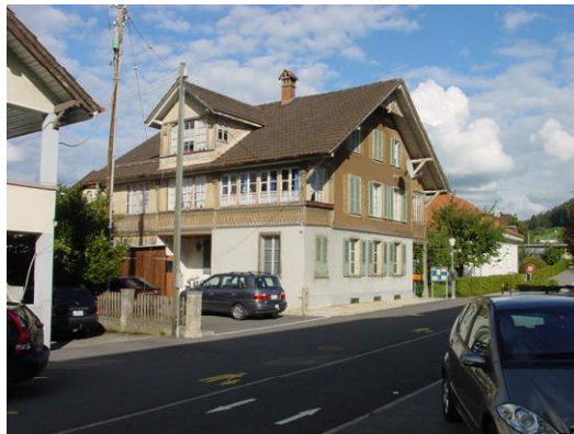
Ansicht Ankunft heute